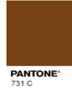
Rejected (Too Dark)