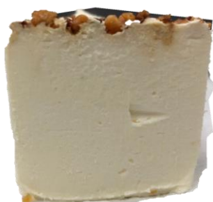
มูสครีมแห้ว เป็นรู